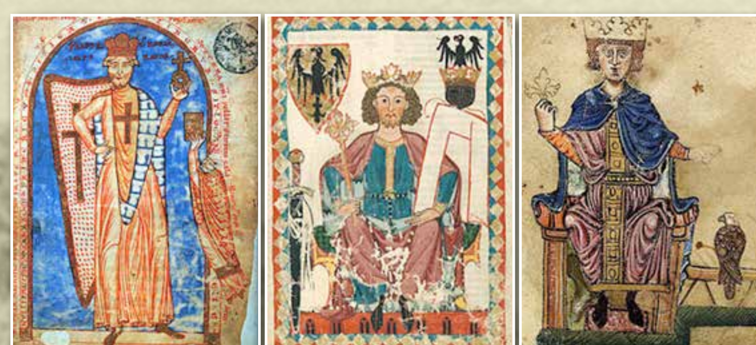
L'imperatore Federico I Barbarossa. The emperor Frederick I. L'imperatore Enrico VI. The emperor Henry VI. L'imperatore Federico II. The emperor Frederick II.