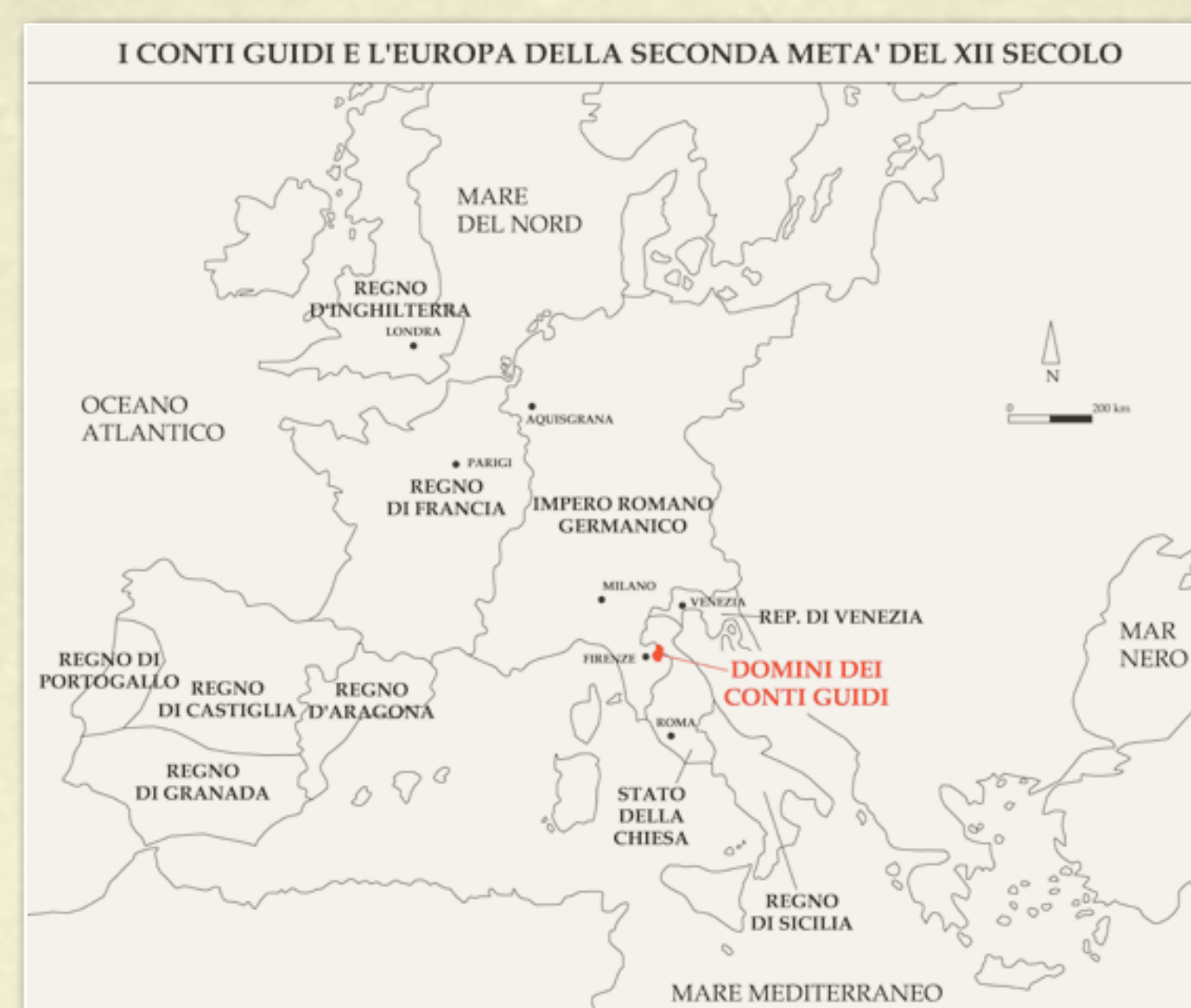
I Conti Guidi nell'Europa del XII secolo con i loro domini in rosso. Counts Guidi and the 12th century Europe with their dominions in red.