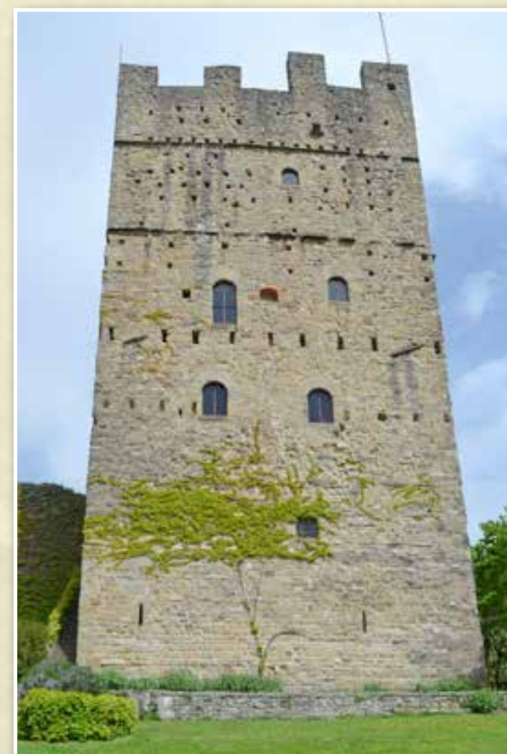
La torre palaziale del castello di Porciano. The great palatial tower of Porciano castle.

Counts Guidi of Porciano Modigliana's arms in a modern replica of a 1414 original one actually enshrined in Santa Maria Assunta church in Stia.