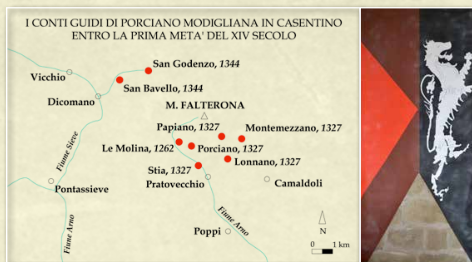
I domini dei conti Guidi di Porciano Modigliana nel XIV in Casentino segnalati dai punti rossi e, a lato del nome, dalla data di citazione nei documenti storici.

Counts Guidi dominions in Casentino Valley during 14th century marked by red points and the year of mention in historical documents.