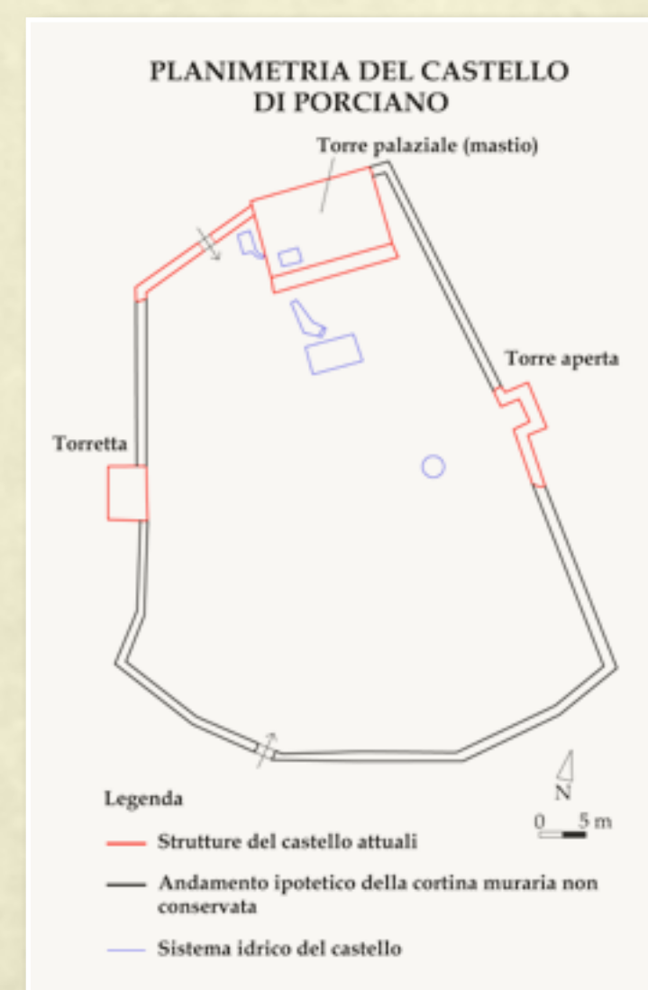
La planimetria del castello di Porciano e le sue strutture superstiti. The planimetry of Porciano castle and its survivors structures.