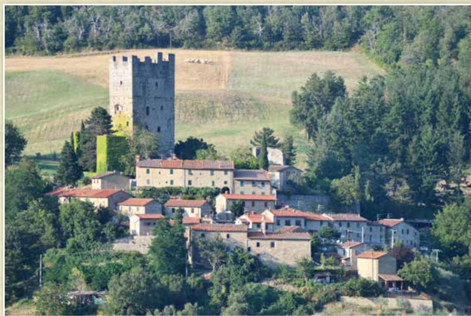
Il castello e il borgo di Porciano da sud-ovest. The castle and the hamlet of Porciano from south-west.

Questi privilegi furono confermati tra il 1164, il 1191, il 1220 e il 1247 in diversi documenti redatti dagli imperatori svevi Federico I Barbarossa (1122-1190), Enrico VI (1165-1197) e Federico II (1194-1250) in cui alla famiglia comitale viene attribuito il titolo di Comes Tusciae e Comes palatinus Tusciae . Porciano è presente in tutte e tre queste attestazioni come Porcianum.